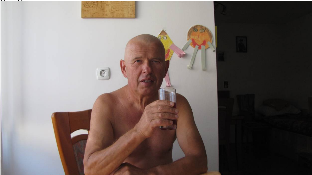
(Slika 7 »gologlav...«)

Ob zaključku naj povem, da obljuba dela dolg. Prijateljem sem namreč obljubil, da če pridem na Mont Blanc, si obrijem glavo. Rečeno storjeno! Na ponedeljkov sestanek Planinskega društva Grosuplje sem prišel povsem gologlav!