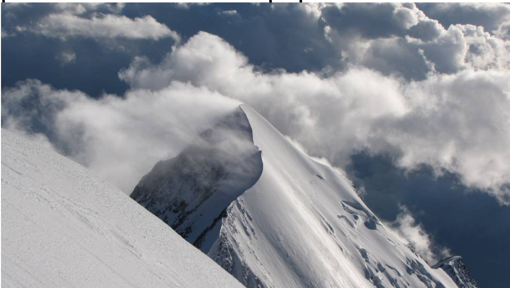
(Slika 3 »na poti do bivaka«)