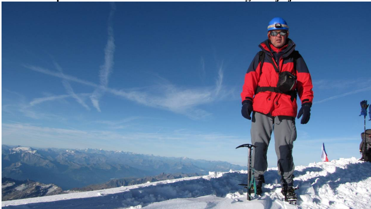
(Slika 6 »vrh«)

Dobro smo napredovali. Proti vrhu se je gaz zožila na 30 cm špice, po tej špici smo šli po grebenu do vrha, na obe strani pa zrli v spoštljivo strmino 45 in več stopinj naklona. Vreme je bilo na naši strani, ponoči se je razjasnilo, a postalo tako mraz, da je fotoaparata komaj deloval. Od bivaka do vrha smo potrebovali tri ure. V čudoviti jasnini krasnega jutra smo ob 7.30 uri stopili na vrh Mont Blanca. Občutek zmagoslavja je bil fantastičen.