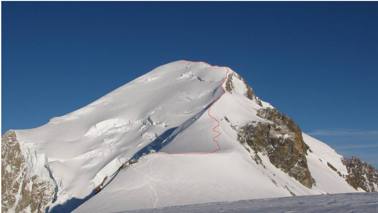
(Slika 4 »bivak, greben, vrh«)

Ta je bil poglavje zase: kovinska škatla, velika 6x5, v katero si lahko vstopil od zunaj po stopnicah navzgor in nadaljeval v notranjost po stopničkah navzdol. Že prej so me opozorili, da je bivak zelo zanemarjen, da notri smrdi in da je povsod vse polno smeti. Res je bilo tako, pod stopnicami, kjer bil velik kup smeti, bi sicer lahko spala dva človeka. A to še ni bilo vse. Bivak je bil poln mladih, nesramnih Poljakov. Ko so le-ti videli, da prihajamo, so se vsi polegli po deskah (te so tam namesto postelj). Kljub našemu prigovarjanju in kasnejšem prerekanju, da se vendarle lahko malce bolj stisnejo skupaj, pa bomo vsi lahko ležali, niso o tem hoteli prav nič slišati. Tako se je naših šest članov poleglo kar po mokrih tleh, sam pa sem našel majhno desko, se nanjo usedel, pred sebe dal nahrbtnik, se nanj naslonil in tako prebedel noč. Težav pa še ni bilo konec. V prvi koči smo jedli zelenjavno juho, ki mi je žal dodobra prevetrila črevesje; ponoči sem šel tako štirikrat na WC.